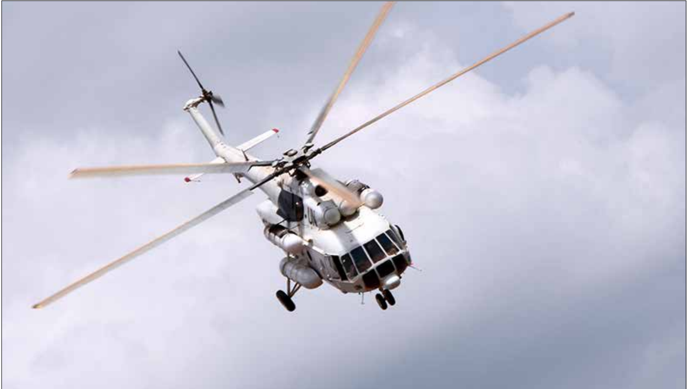
Photo de l'atteinte de la pleine capacité opérationnelle de la MINUSCA

Le 3 février 2017, les Casques bleus de la MINUSCA déployés à Bocaranga, dans la préfecture de l'Ouham Pende (Nord-est), sont intervenus pour arrêter les violences contre les populations civiles et les organisations humanitaires commises par les groupes armés. L'intervention impartiale des Casques bleus, suivie de patrouilles régulières, a permis le retour au calme dans la ville. La protection du camp de déplacés, de l'hôpital et des installations des ONG a été renforcée. Un hélicoptère de la Force de la MINUSCA a par ail-