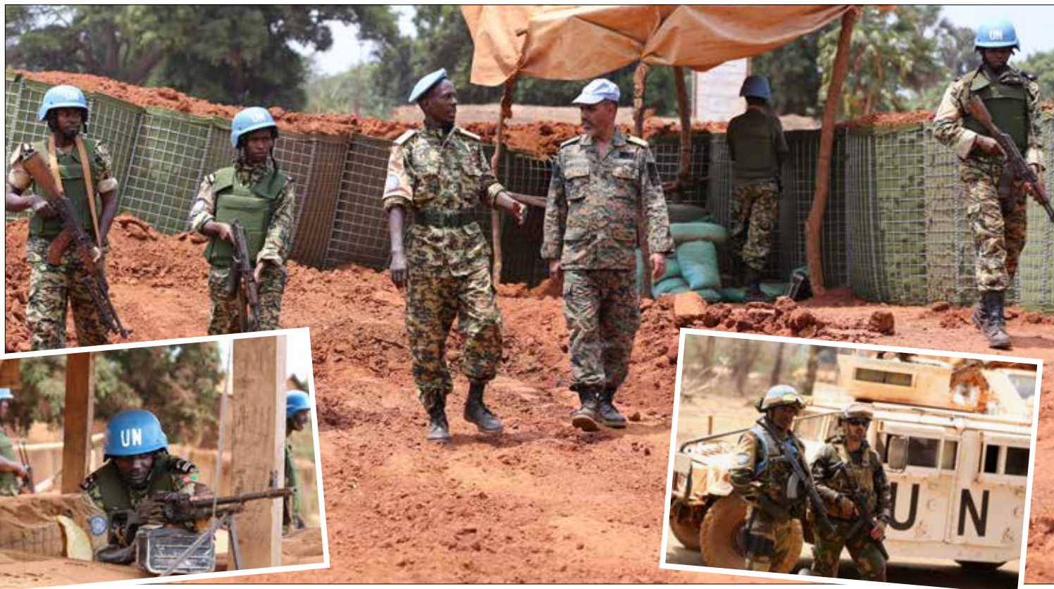
Dispositif sécuritaire - Bambari