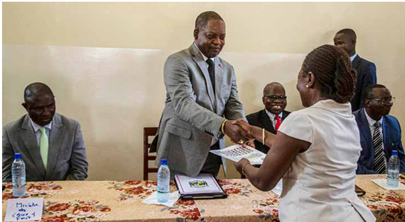
■ Remise du répertoire officiel des compétences féminines au sein des forces de défense par le Premier ministre, Firmin Ngrébada

Les femmes en uniforme de la République centrafricaine comptent sur le lancement d'un nouveau répertoire officiel des compétences féminines au sein des forces de défense pour valoriser la représentativité des femmes aux postes de décision. Le document, produit avec le soutien de la MINUSCA, a été remis au Premier ministre Firmin Ngrébada lors d'une cérémonie qui s'est tenue à Bangui, le 11 mars 2020, trois jours seulement après la célébration de la Journée internationale de la femme.