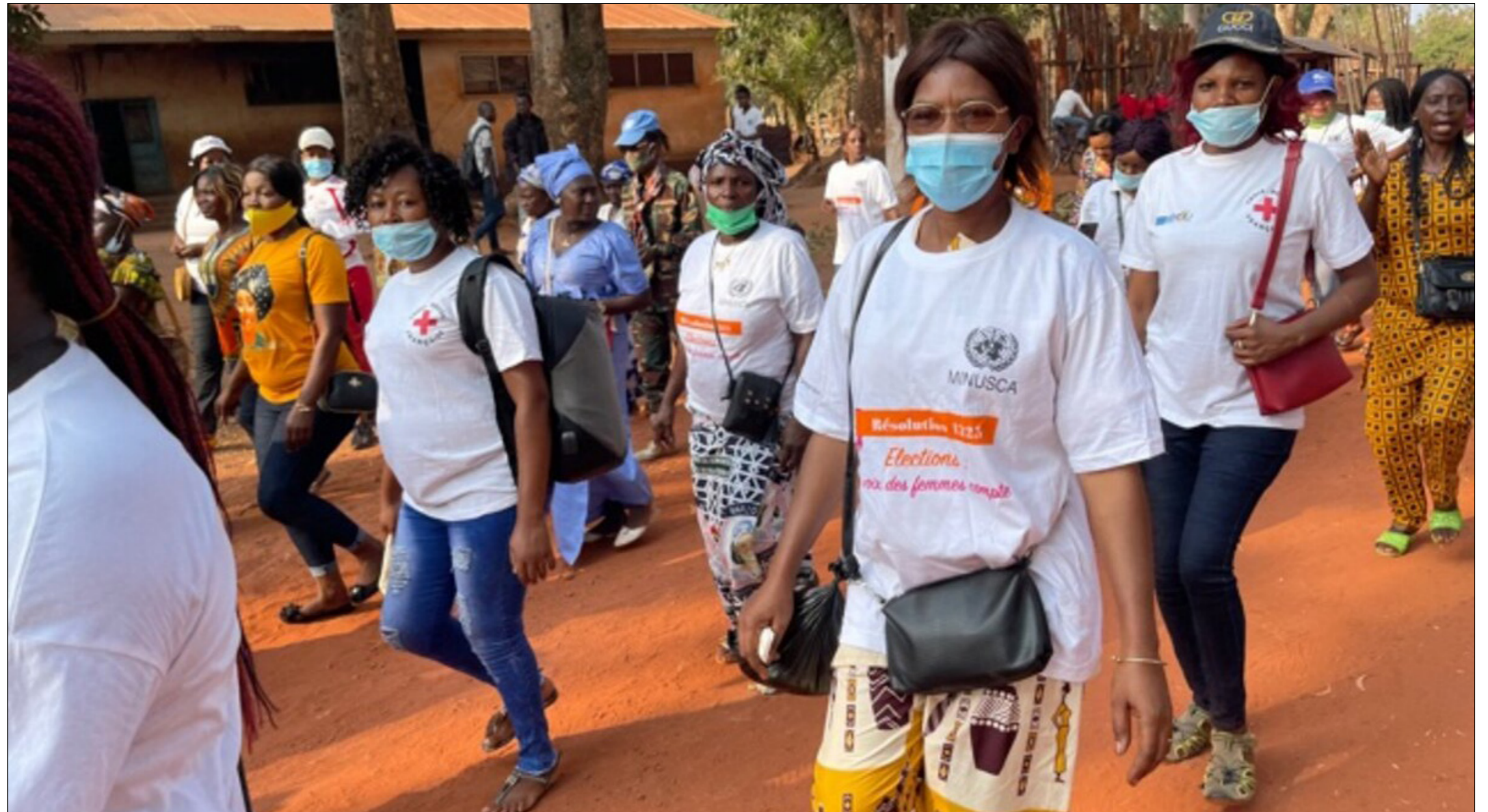
■ Marche des femmes Casques bleus de la MINUSCA de la ville de Berberati à la Journée internationale des droits de la Femme