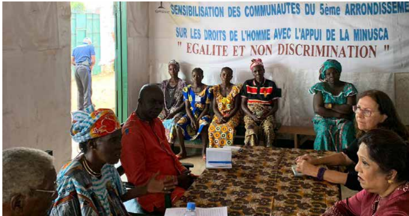
■ Séance de sensibilisation des sur les droit de l'homme dans le 5e arrondissement de Bangui

En République centrafricaine comme ailleurs, les victimes de violences sexuelles et basées sur le genre (VSBG), y compris de violences sexuelles liées aux conflits (VSLC), font souvent face à une stigmatisation et un rejet de la part de leurs familles et de la communauté, ainsi qu'un risque de représailles de la part des auteurs. En sus, les services médicaux, psychosociaux ou juridiques accessibles aux victimes sont rares et ont une capacité limitée. Ces obstacles cumulés ont un effet négatif sur l'aptitude des victimes et témoins de VSBG à faire part des incidents et à recevoir le soutien nécessaire.