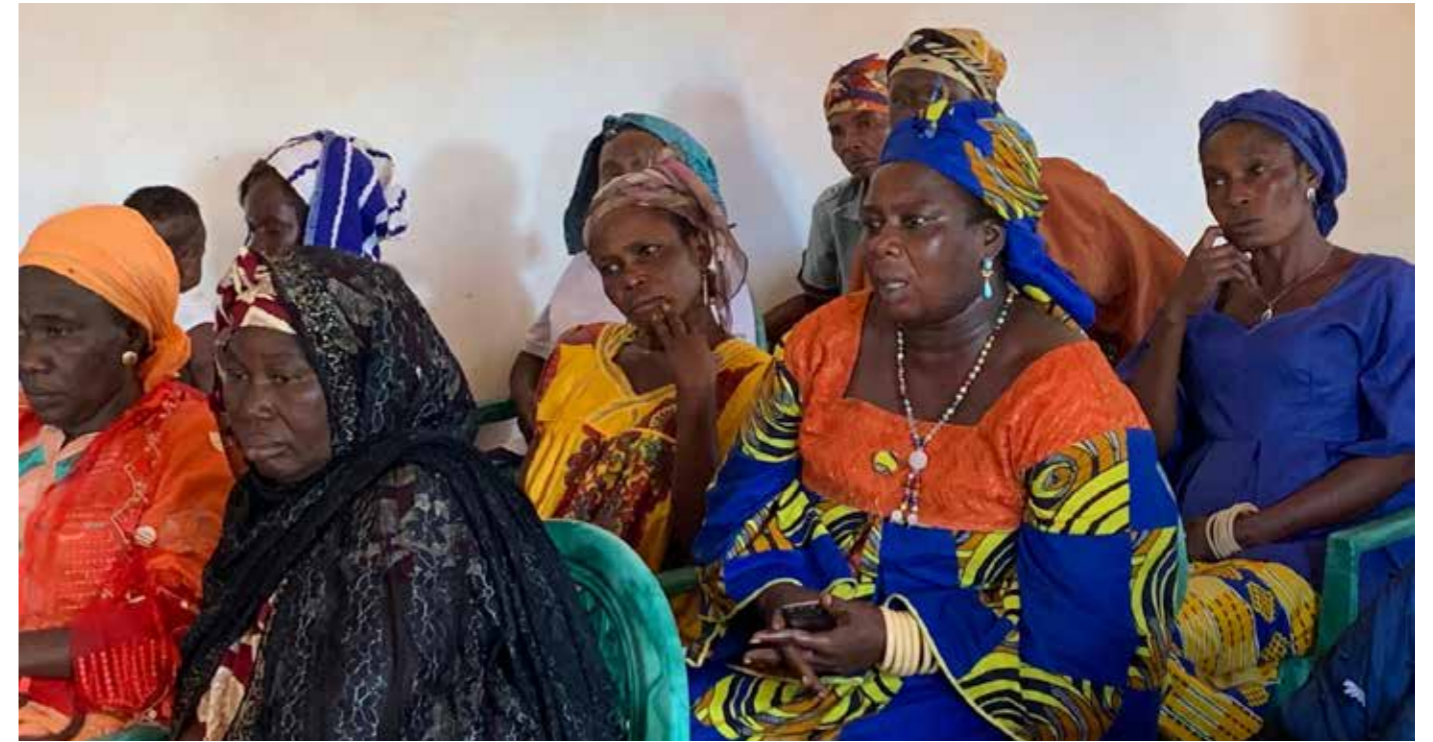
■ Des participantes lors de la sensibilisation des sur les droit de l'homme dans le 5e arrondissement de Bangui

NUSCA, la section Protection des femmes assure la coordination entre les différentes composantes de la Mission et les partenaires externes, sur la prévention et la réponse au VSLC. Cette coordination s'effectue à travers l'organisation d'un dispositif de suivi, d'analyse et de rapport. A travers cette initiative, la MINUSCA et ses partenaires échangent