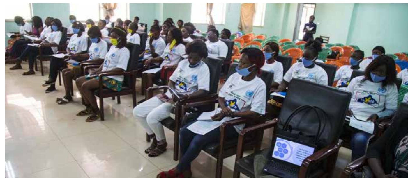
■ Vue des participantes de la formation des femmes engagées pour une meilleure gestion des conflits post-électoraux en RCA organisée par la MINUSCA en partenariat avec l'ONG RFFED

Elles sont issues de toutes les couches socioéconomiques centrafricaines et veulent un avenir meilleur pour les femmes en Centrafrique, mais ne savent pas toujours comment agir pour y parvenir. A l'invitation de la MINUSCA, en partenariat avec le Réseau des Femmes et filles élites pour le développement (RFFED), 120 femmes ont bénéficié d'un renforcement de capacités les 3 et 4 février 2021 à Bangui, sur le leadership politique des femmes pour la gestion des conflits post-électoraux.