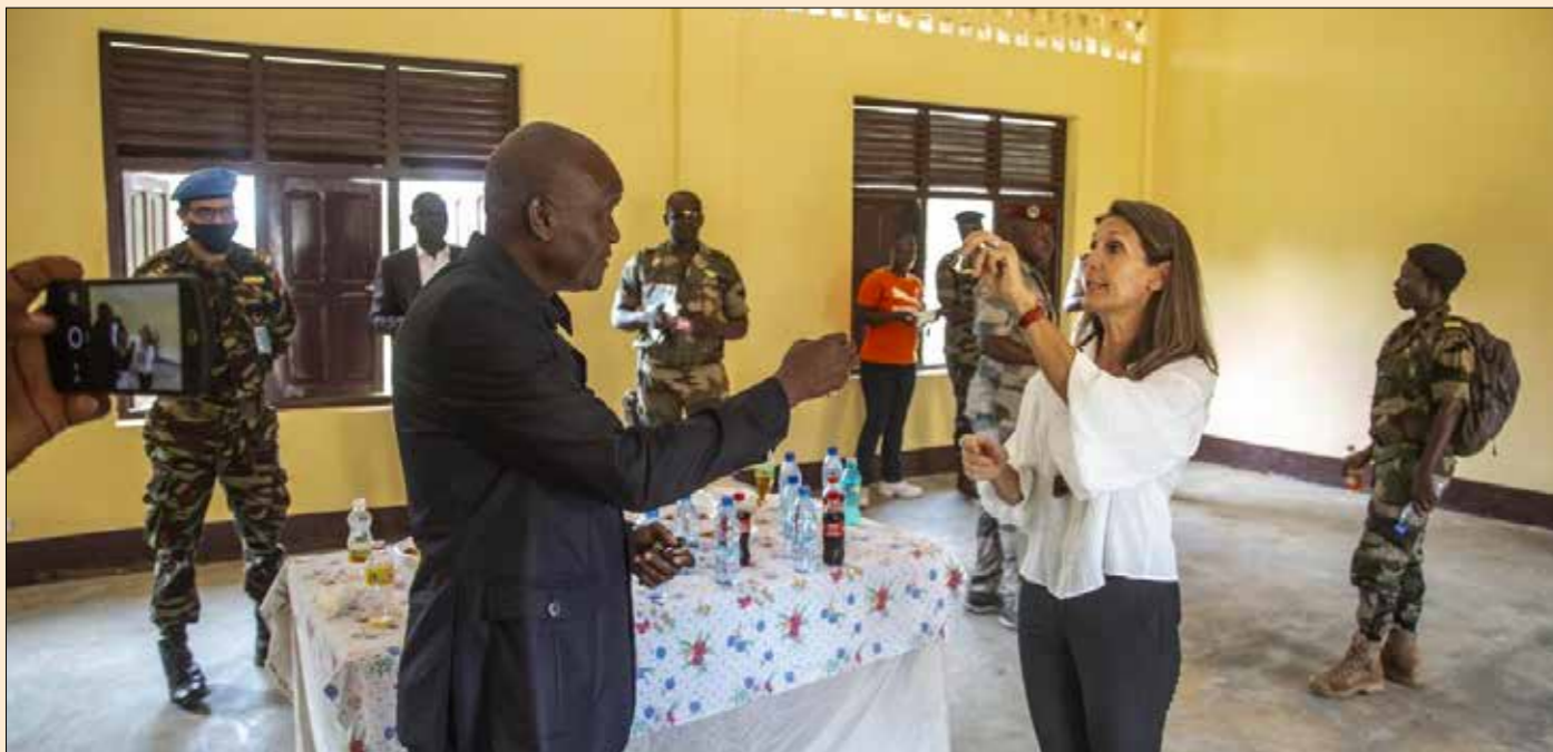
■ Remise d'un ensemble de bâtiments réhabilités par la section de la Réforme du secteur de la sécurité (RSS) de la MINUSCA, spécialement conçus pour le personnel militaire féminin

La MINUSCA a procédé le 25 novembre 2020, au camp Kassaï à Bangui, à la remise d'un ensemble de bâtiments réhabilités, spécialement conçus pour le personnel militaire féminin –remettant au goût du jour les questions de genre dans la Réforme du secteur de la sécurité (RSS).