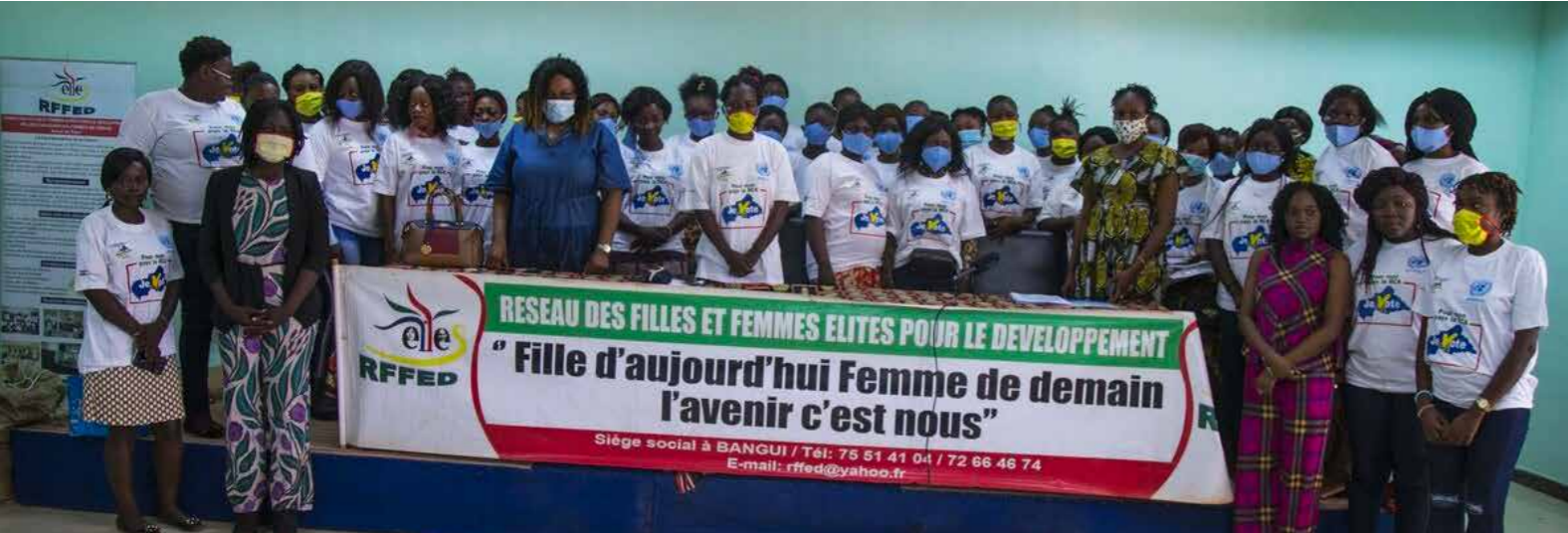
■ Photo de famille de fin de formation des femmes engagées pour une meilleure gestion des conflits post-électorales en Rca organisée par la MINUSCA en partenariat avec l'ONG RFFED

bonnes uniquement pour mobiliser les foules pendant la campagne ; mais participer entièrement au jeu démocratique et démontrer leurs capacités à apporter des solutions nouvelles aux problèmes de la société. « Les femmes ne veulent plus rester dans cette posture ; elles aspirent à plus de responsabilités. La nécessité d'une « alternance générationnelle » chez les jeunes filles se fait de plus en plus sentir. Il existe un besoin réel de construction d'un leadership des femmes en matière électorale », a fait valoir la coordonnatrice du RFFED, Vincentie Panika.