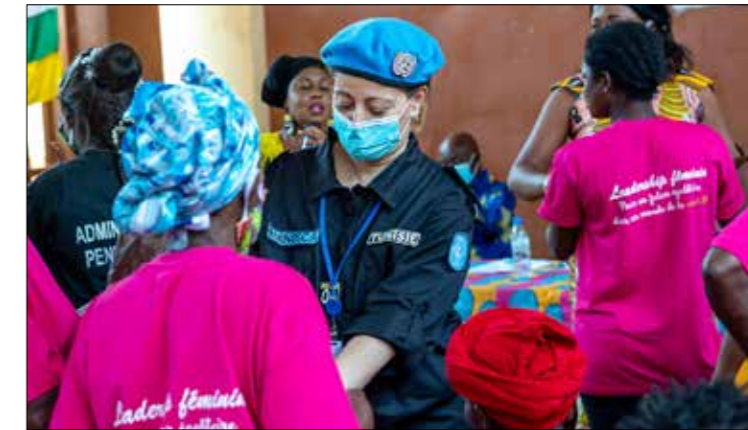
■ Les femmes détenues à la maison d'arrêt et de correction de Bimbo à la commémoré la JIF à travers une journée portes ouvertes

Autre localité, même plaidoyer. Plus de 200 femmes, à Berberati, représentant les associations, les organisations humanitaires, et femmes de la MINUSCA, ont arpenté, le 8 mars, les artères du chef-lieu de la préfecture de la Mambéré-Kadéï, pour commémorer la Journée internationale des droits de la Femme. La marche s'est déroulée autour du thème « Ensemble, valorisons les droits des femmes ». Les femmes ont remis au sous-préfet de Berberati, en présence de la MINUSCA, un mémorandum contenant, entre autres, des recommandations sur le plan sécuritaire pour faciliter la libre circulation, l'application de la parité dans le recrutement au niveau des institutions publiques, le renforcement de capacité des femmes pour leur autonomisation et leur leadership, l'accès à l'éducation, ainsi que le renforcement de la lutte contre le Coronavirus.