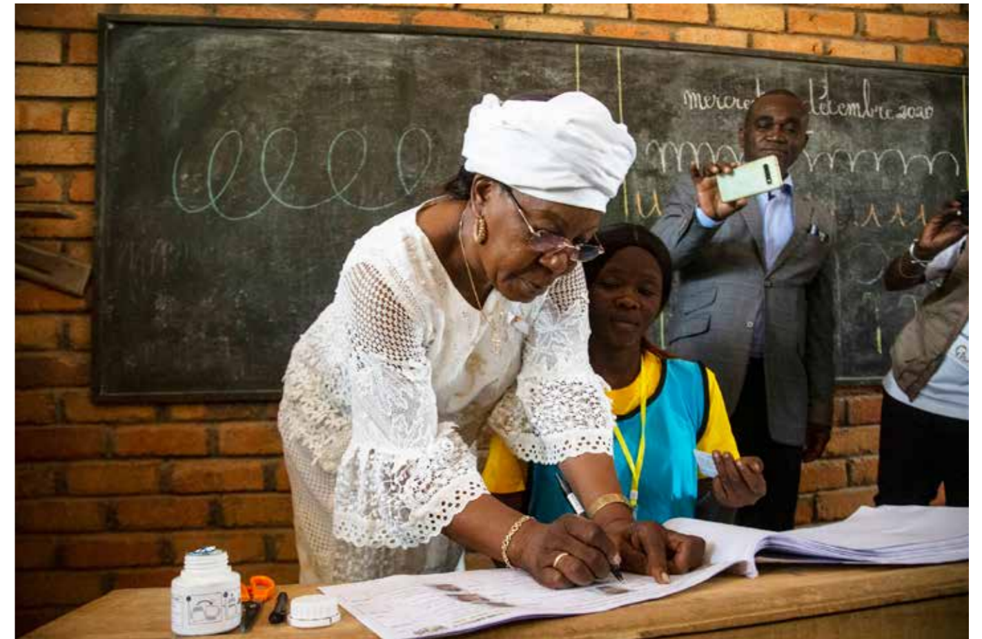
■ Mme Catherine Samba-Panza, ancienne Présidente de Transition, candidate aux élections présidentielles et législatives du 27 décembre 2020

faveur des femmes leaders en vue de leur participation au processus de paix, la vulgarisation de l'Accord de paix et de réconciliation (l'APPR-RCA) à travers les 16 préfectures du pays, ainsi que leur