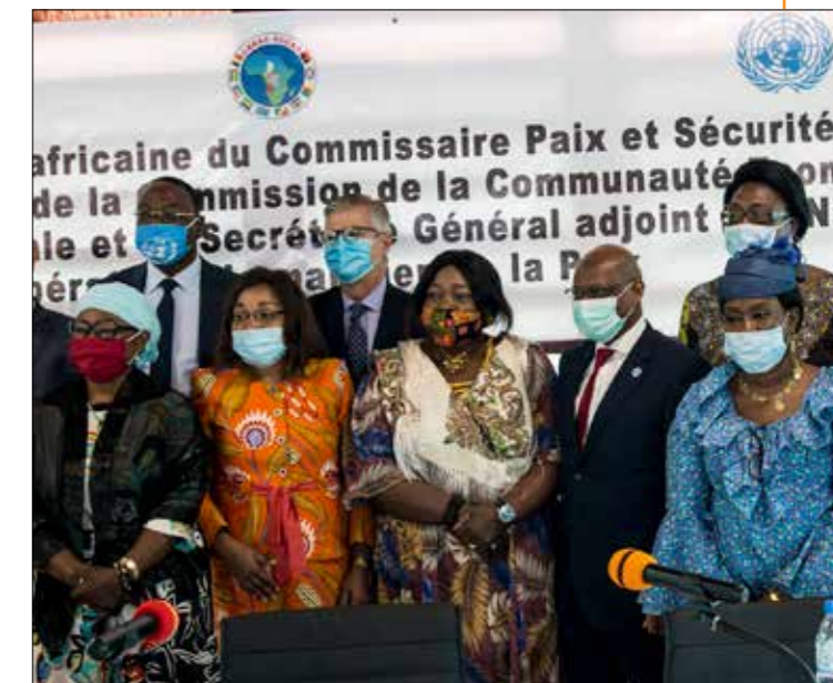
■ Photo de famille après la réunion de travail avec la délégation UA, CEEAC et ONU et les femmes leaders de Centrafrique