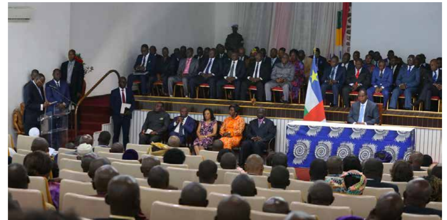
■ Photo du lancement officiel de la consultation populaire nationale dans le cadre de la Commission vérité, justice, réparation et réconciliation (CVJRR), en présence des membres du Gouvernement chefs des missions et corps diplomatique dont la MINUSCA

Conformément à son mandat, la Division des Droits de l'Homme appuie de manière soutenue le processus de recherche de la vérité en RCA en mettant un accent particulier sur l'égalité de genre.