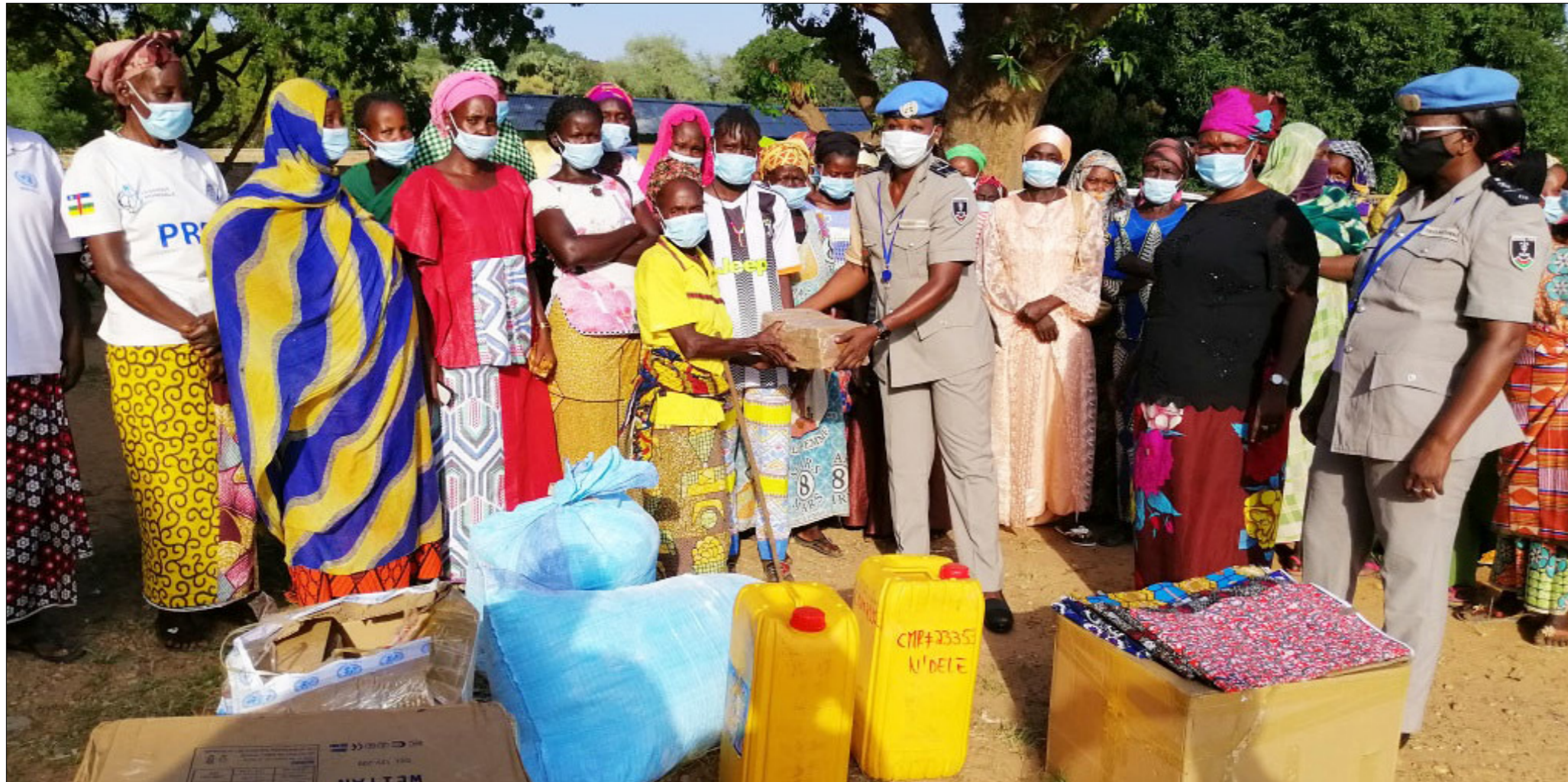
■ Distribution de kits scolaires et de vivres offerts par le réseau des femmes de la Police des Nations Unies de la MINUSCA aux veuves dans la ville de Ndele