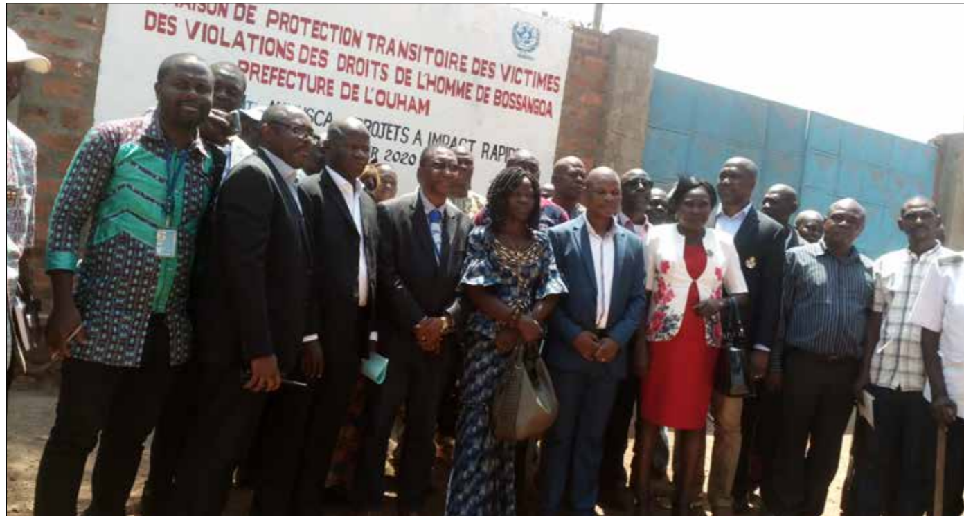
■ Photo de famille lors de la remise de la maison de protection transitoire des victimes des violations des droits de l'homme de Bossangoa

et salons, une cuisine, un bureau, un magasin et des toilettes séparées hommes et femmes et d'une moto. La Maison est dotée d'un groupe électrogène. Toutes ces commodités financées par la MINUSCA à hauteur de 18,435,778 de FCFA, permettront aux personnes reconnues comme victimes ou témoins de violations des droits de l'homme, de bénéficier d'un refuge sûr. Cette Maison de protection est d'ailleurs la seule structure de ce genre dans toute la préfecture de l'Ouham. Depuis la remise officielle du bâtiment aux autorités locales, une centaine de pensionnaires dont 65% de femmes y ont été accueillis.