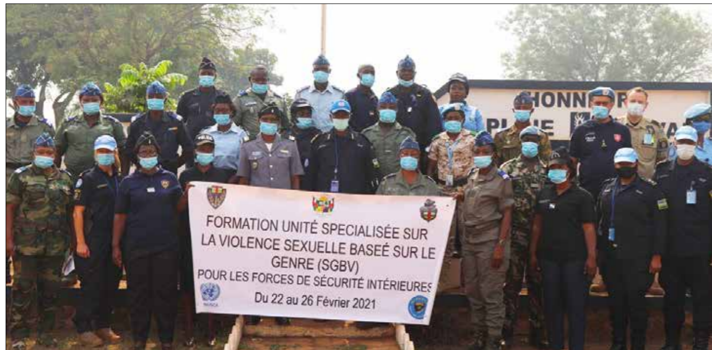
■ Photo de famille de fin de formation Unité spécialisée sur la violence sexuelle basée sur le genre pour les FSI

En vue d'appuyer l'intégration du Genre dans la réforme des Forces de sécurité intérieure, le PNUD et la MINUSCA, ont mené des activités consacrées à la protection des civils, ainsi qu'à la participation des femmes dans toutes les actions de promotion de la paix et au sein des institutions nationales.