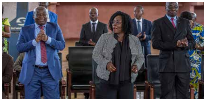
■ Le Ministre de la Sécurité publique, Henri Wanzet Linguissara, et la Ministre de la Promotion de la femme, de la famille et de la Protection de l'enfant, Aline Gisèle PANA à la cérémonie de la journée internationale des droits de la Femme