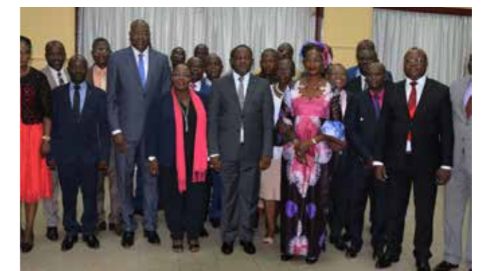
■ Photo de famille de fin du séminaire gouvernemental en prélude aux consultations nationales sur la future Commission Vérité, Justice, Réparation et Réconciliation