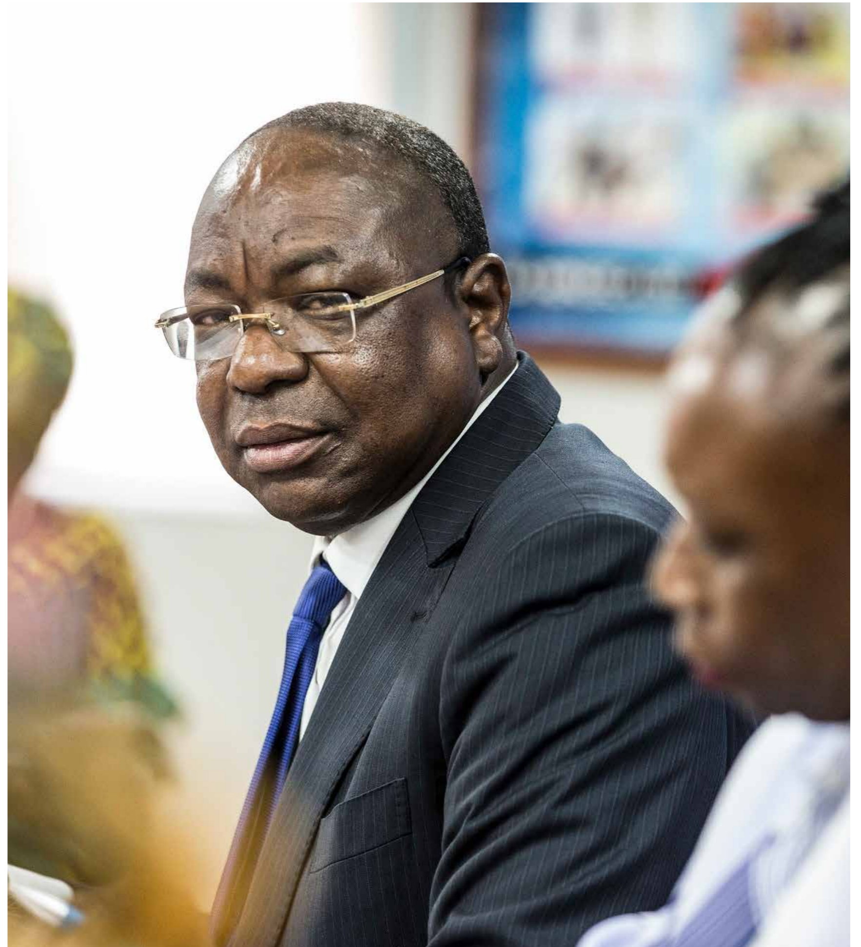
■ Le Chef de la MINUSCA, Mankeur Ndiaye, lors de la rencontre des femmes leaders centrafricaines

La résolution 2552 prie la MINUSCA de tenir pleinement compte des questions de Genre dans tous les aspects de son mandat et d'aider les autorités centrafricaines à garantir la participation, la contribution et la représentation pleines, égales et véritables des femmes, y compris les rescapées de violences sexuelles, dans tous les domaines et à tous les niveaux. Cette participation concerne également le processus politique et le processus de réconciliation et dans le cadre de la mise en œuvre de l'Accord de paix, les activités de stabilisation, la justice transitionnelle, les travaux de la Cour pénale spéciale (CPS) et de la Commission vérité, justice, réparation et réconciliation (CVJRR). La réforme du secteur de la sécurité et les activités de désarmement, démobilisation, réintégration et rapatriement (DDRR) ainsi que les préparatifs des élections de 2020 et 2021, notamment en mettant à disposition des conseillers et conseillères pour les questions de genre, sont également concernés par la participation des femmes, conformément à notre