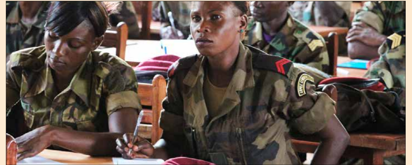
■ Photo de formation du personnel féminin des FACAs

La MINUSCA a procédé le 25 novembre 2020, au camp Kassaï à Bangui, à la remise d'un ensemble de bâtiments réhabilités, spécialement conçus pour le personnel militaire féminin –remettant au goût du jour les questions de genre dans la Réforme du secteur de la sécurité (RSS).