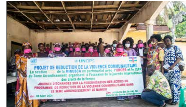
■ La Ministre de la Promotion de la femme, de la famille et de la Protection de l'enfant, Aline Gisèle PANA, place la femme au centre de la consolidation de la paix à la cérémonie de la journée internationale de la femme à Bangui.

A Ndele, les femmes de Bamingui-Bangoran ont célébré dans la joie et la cohésion sociale la JIF 2021, à travers une marche sillonnant les quartiers des 1er et 2e arrondissements de la ville. Dans les propos de circonstance, un accent particulier a été mis sur la scolarisation massive des filles le rejet des mariages précoces ou forcés et l'excision, afin de donner la chance aux filles de réussir le pari de 2030 en faisant