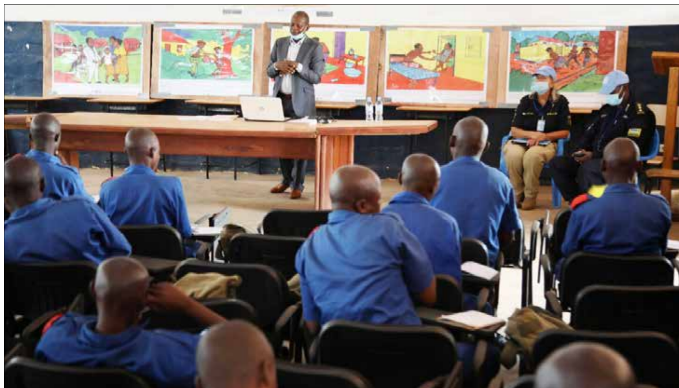
■ Photo de formation des élèves gendarmes sur la violence sexuelle basée sur le genre

Les violences sexuelles basées sur le genre (VSBG) sont des violences dirigées spécifiquement contre un homme ou une femme du fait de son sexe. En 2020, plusieurs activités ciblées ont été menées par la police de la des Nations Unies (UNPol) et l'Unité mixte d'intervention rapide et de répression des violences sexuelles faites aux femmes et aux enfants (UMIRR) dans le cadre de la lutte contre les VSBG.