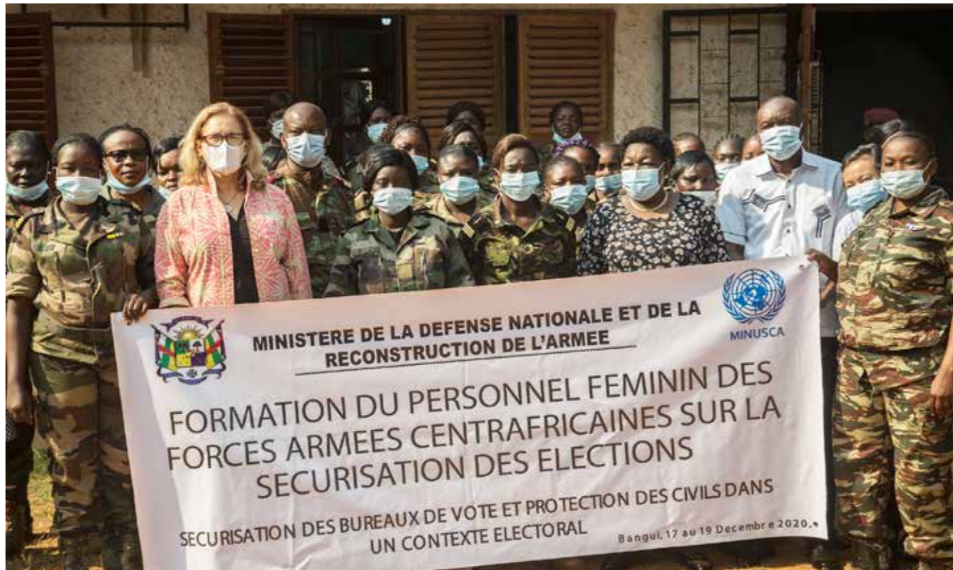
■ Photo de famille du personnel féminin des FACA à la fin d'une formation sur la sécurisation des bureaux de vote et la protection des civils à Bangui

La Centrafrique n'échappe nullement à la règle. C'est pourquoi, à travers la résolution 2499 du Conseil de sécurité, la MINUSCA, via sa composante Genre, s'est vue assignée la mission de « tenir pleinement compte des questions de genre dans tous les aspects de son mandat et d'aider les autorités de la République centrafricaine à garantir la participation, la contribution et la représentation plénières, effectives et véritables des femmes y compris les survivantes de violences sexuelles, dans tous les domaines et à tous les niveaux ».