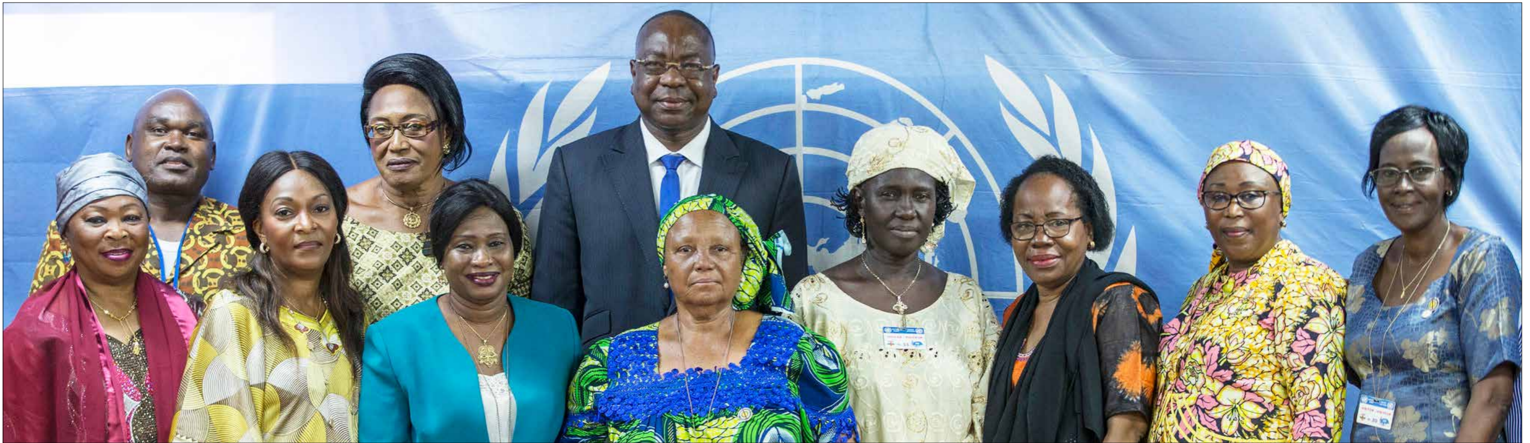
■ Le Chef de la MINUSCA, Mankeur Ndiaye, avec les femmes leaders centrafricaines / Photo UN/MINUSCA - Hervé Sereffio