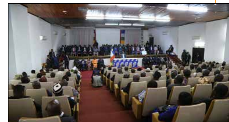
■ Photo du lancement officiel de la consultation populaire nationale dans le cadre de la CVJRR

Il est important d'avancer sur ces deux mécanismes pour rétablir le droit des victimes surtout. Car, ces dernières ont besoin de réparation, et c'est cette réparation qui conduira à la paix.