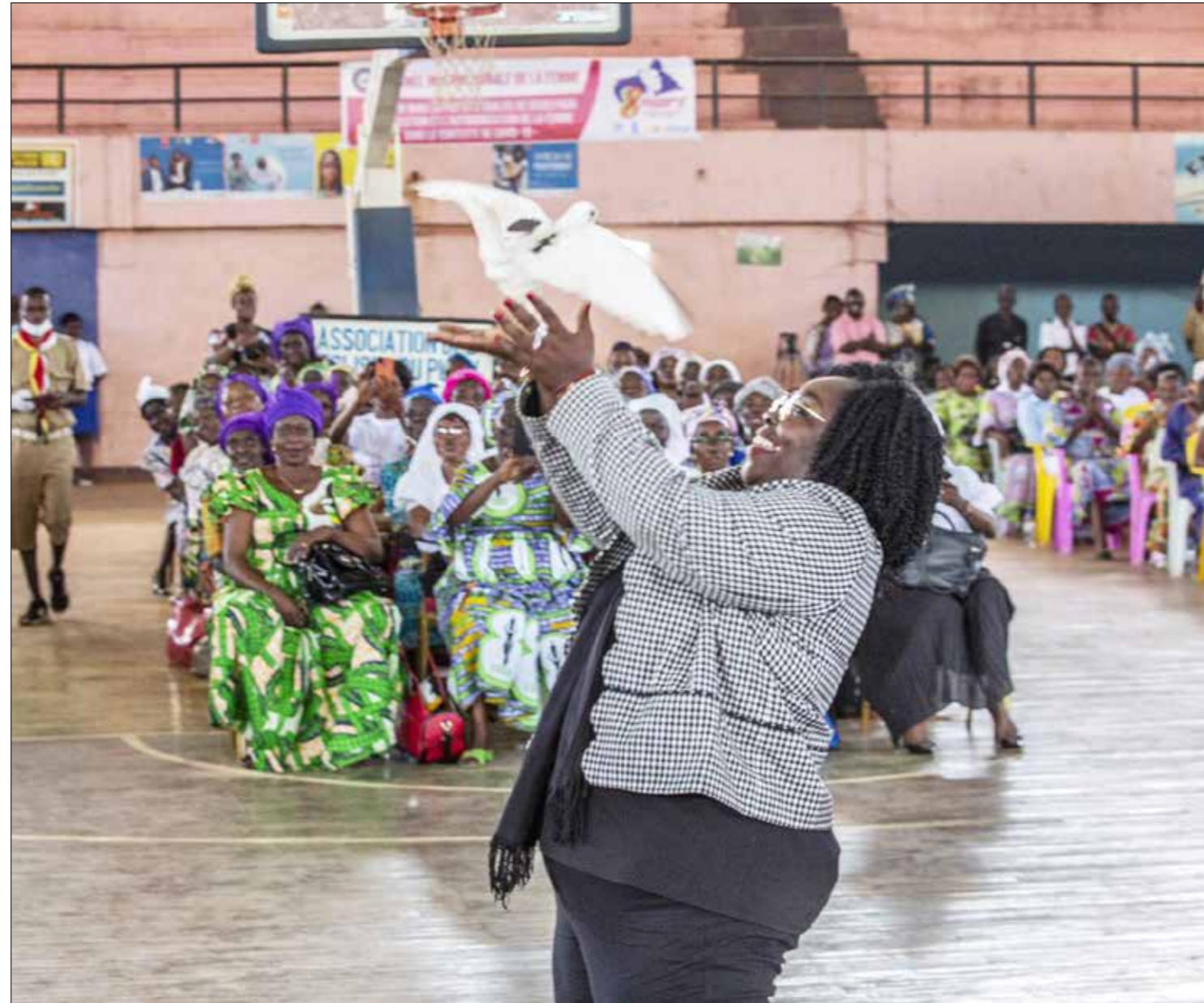
■ La Ministre de la Promotion de la femme, de la famille et de la Protection de l'enfant, Aline Gisèle PANA, place la femme au centre de la consolidation de la paix à la cérémonie de la journée internationale de la femme à Bangui

A u stade 20.000 place de Bangui, l'heure n'était pas seulement à la prière et au recueillement en faveur des autorités et institutions nationales, des forces de défense et de sécurité intérieures. C'était également l'occasion, selon la Ministre de la Promotion de la femme, de la famille et de la Protection de l'enfant, Aline Gisèle PANA, de placer « la femme au centre de la consolidation de la paix ». En effet, a-t-elle soutenu, « sur le plan national des efforts ont été consentis en vue de l'amélioration du statut juridique de la femme par l'élaboration des textes nationaux, tels que la politique nationale de l'égalité, de l'équité, le plan national de la résolution 1325 du Conseil de sécurité des Nations unies, la stratégie de lutte contre la violence basée sur le genre, le profil genre pays, pour ne citer que cela ». En marge de la cérémonie officielle, les détenues de la maison d'arrêt et de correction de Bimbo ont commémoré la JIF à travers