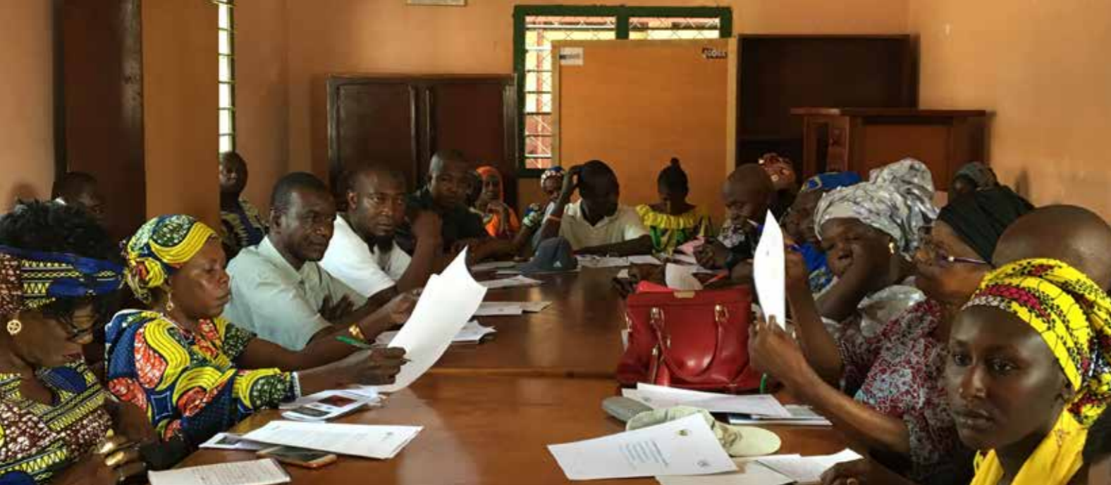
■ Vue des participantes de la réunion des femmes leaders du Comité de mise en œuvre préfectoral (CMOP), du Comité local de paix et réconciliation (CLPR de Bria