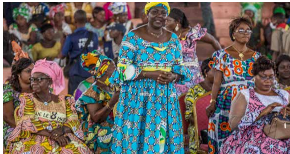
■ Une vue des femmes mobilisées pour la cérémonie de la journée internationale des droits de la Femme à Bangui