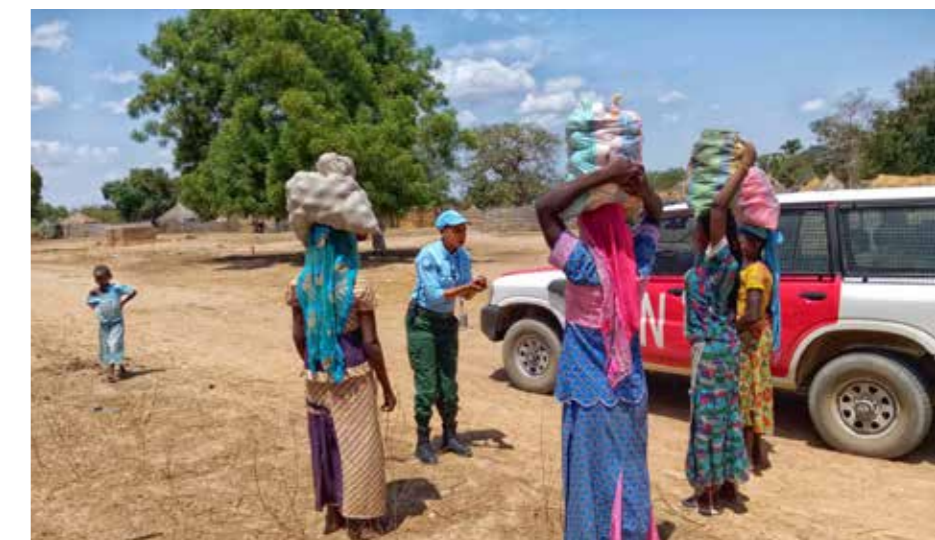
■ Sensibilisation sur le Covid-19 d'un groupe de femmes de Birao (Nord-est de la RCA) par une policière de la MINUSCA lors d'une patrouille