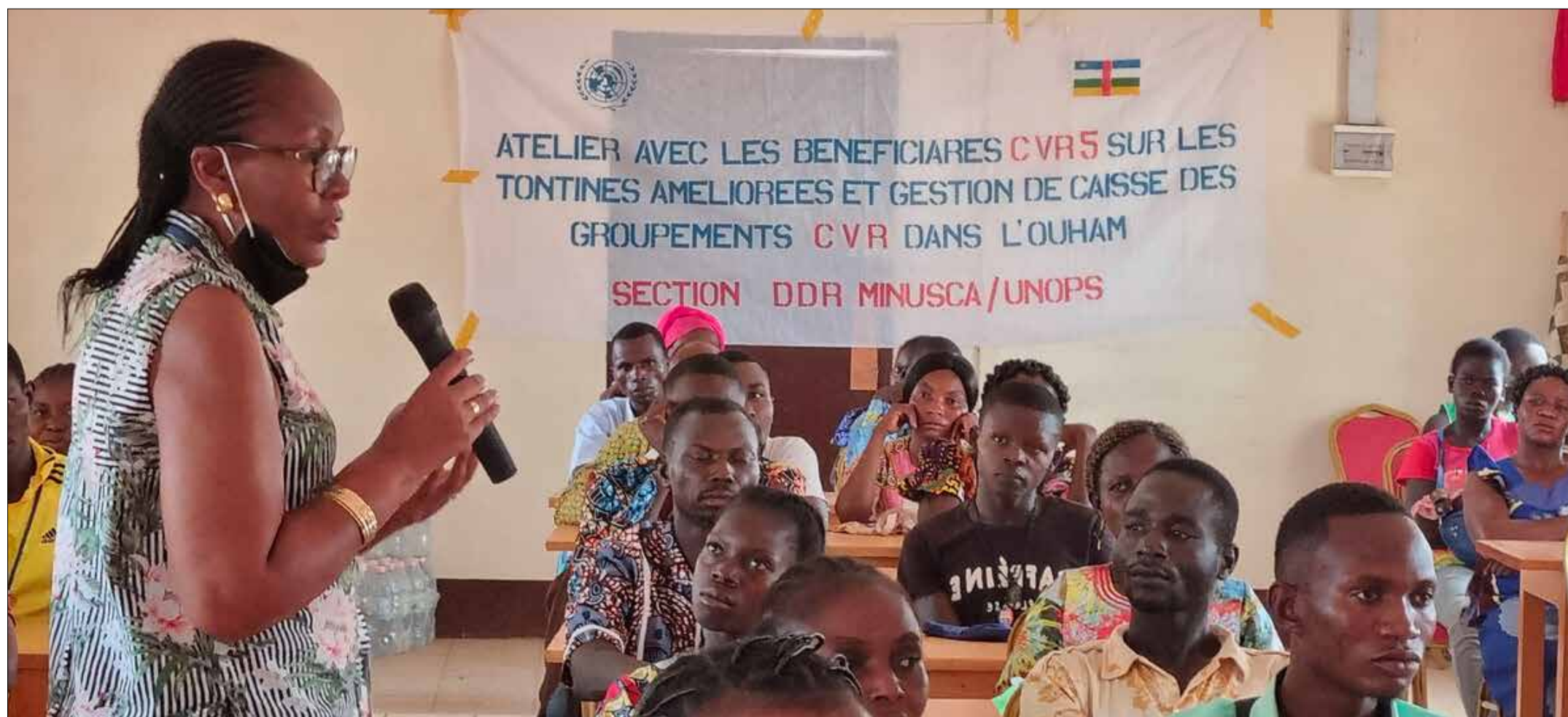
▲ Des bénéficiaires du programme de Réduction de la violence communautaire lors d'un atelier de formation sur les tontines améliorées et la gestion des caisses de groupements

Dans le cadre de ses activités de sensibilisation, la section Désarmement, démobilisation et réintégration (DDR) de la MINUSCA a organisé, le 23 mars 2022, à l'intention de 50 bénéficiaires dont 30 femmes du programme de réduction de la violence communautaire (CVR), un atelier de formation sur les tontines améliorées et la gestion des caisses de groupements. L'objectif de cet atelier était de former les bénéficiaires aux différentes formes de tontines, à leurs techniques de fonctionnement et de réussite, mais également aux sanctions et procédures judiciaires liées à des cas d'insolvabilité des membres.