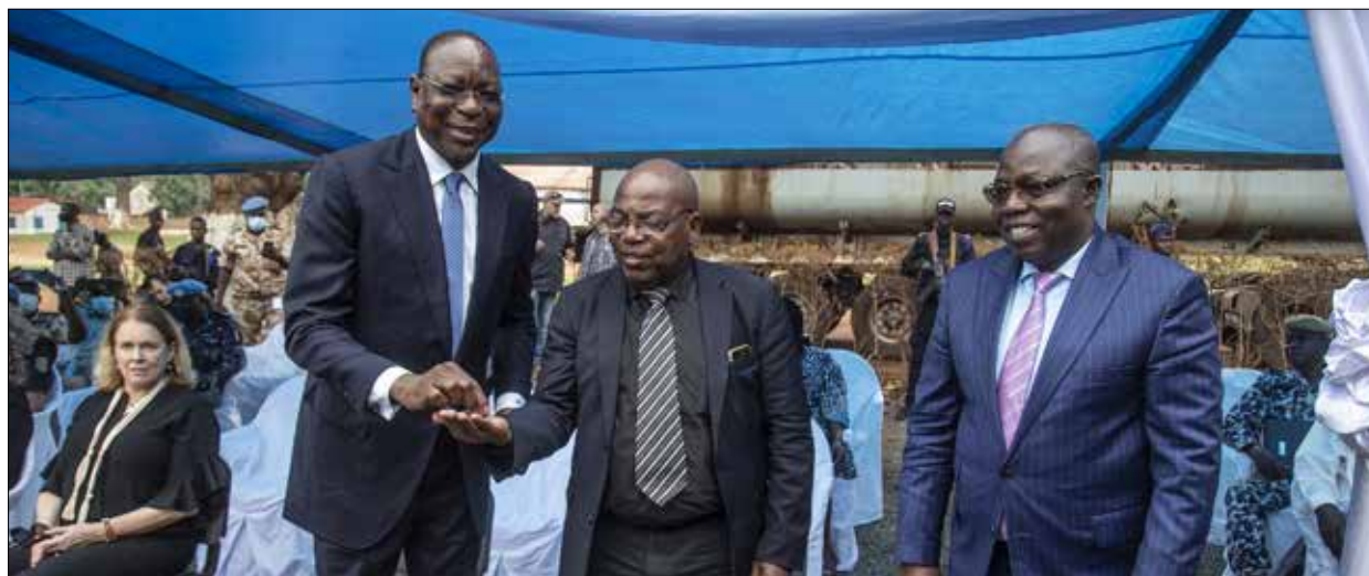
▲ Remise de clef de moto par le Représentant spécial du Secrétaire général des Nations Unies et Chef de la MINUSCA, Mankeur Ndiaye, au ministre de la Sécurité Michel Nicaise NASSIN

« La présente cérémonie témoigne de la volonté de la MINUSCA d'accompagner sans relâche le gouvernement centrafricain qui s'est fixé comme objectif le relèvement économique, la lutte acharnée contre la fraude illicite de nos pierres et métaux précieux et l'exercice des activités minières conformément aux dispositions des textes en vigueur. Ces motos avec leurs accessoires permettront véritablement à l'Unité spéciale anti-fraude d'être opérationnelle dans la lutte contre la fraude et la contrebande dans le secteur minier en Centrafrique ».