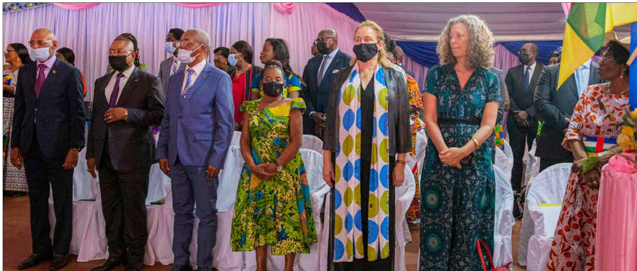
▼ ▲ Aperçu des officiels à la cérémonie de la Journée internationale pour les droits des femmes, édition 2022

La célébration s'est achevée par une visite guidée des stands de vente de produits locaux réalisés par les femmes centrafricaines au siège de l'Organisation des femmes centrafricaines.