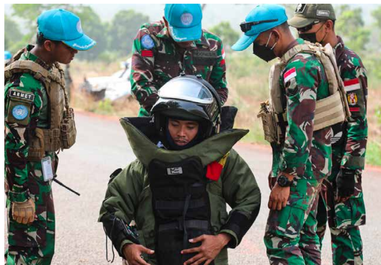
▲ Les démineurs de la Compagnie indonésienne de Génie de la MINUSCA se préparent à détruire les roquettes trouvées à Boali

Par Lieutenant-Colonel Abdoul Aziz OUEDRAOGO