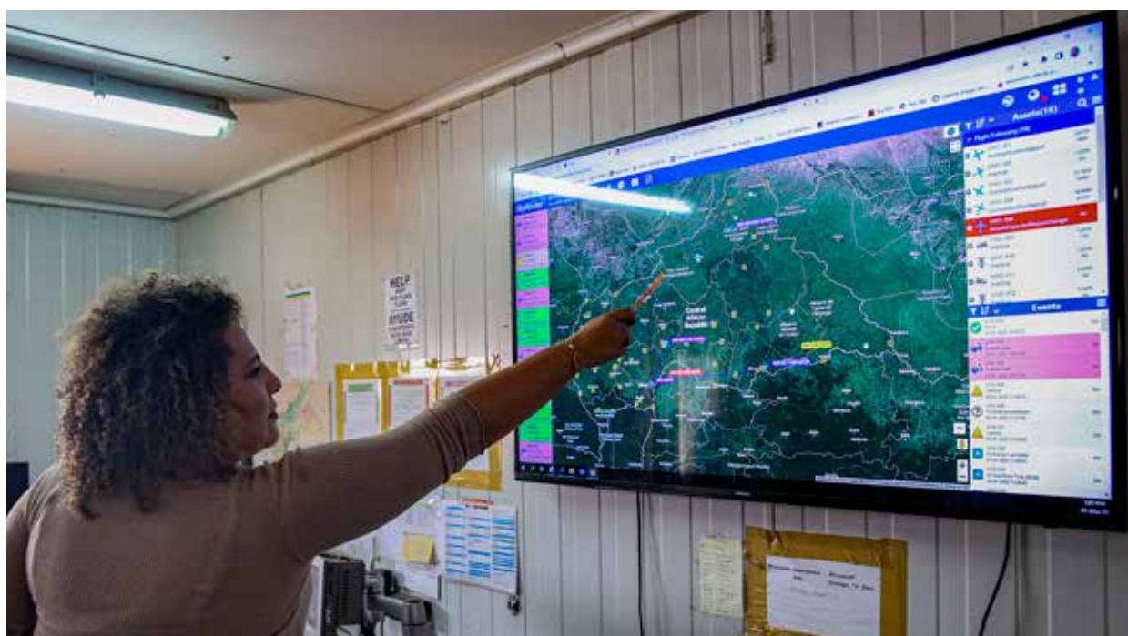
▲ Lecture de la cartographie numérique pour la planification de vol par un personnel de la Section d'aviation

nous aurons notre propre terminal, je crois que ce problème sera résolu et nos avions seront stationnés à un endroit précis sous notre contrôle. C'est un projet d'envergure parce que la MINUSCA n'a pas vocation à rester définitivement dans ce pays et nous allons laisser ce joyau au gouvernement de la République centrafricaine.