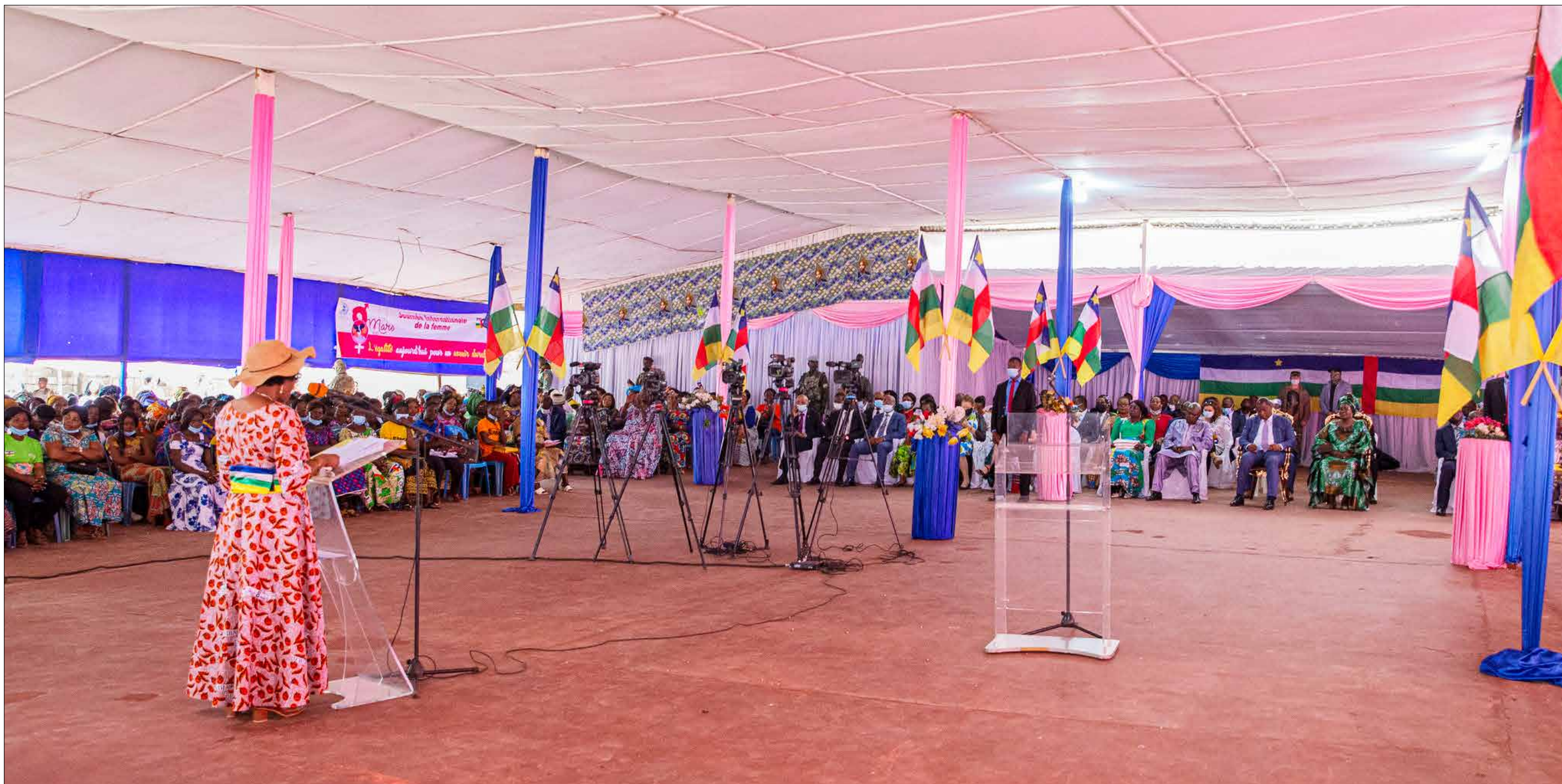
▲ Ouverture de la cérémonie de la Journée internationale pour les droits des femmes, édition 2022, en présence du couple présidentiel Brigitte et Faustin Archange Touadera et des membres du gouvernement