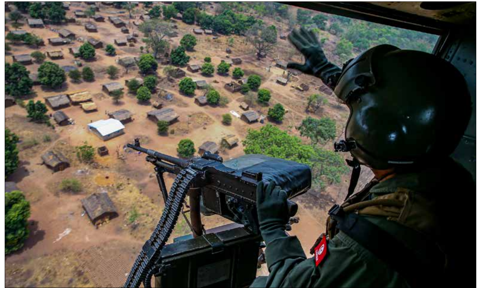
▲ Survol de la ville de Bouca en hélicoptère