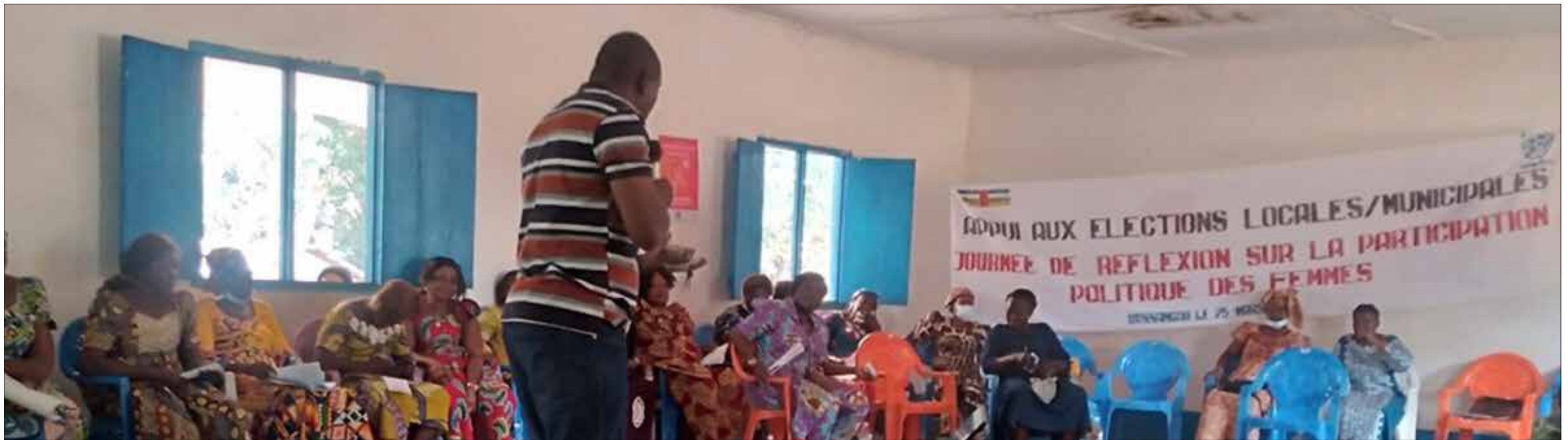
▲ Des femmes de Bossangoa pendant la journée de réflexion sur la participation politique des femmes

Le Bureau Régional de la Division de l'assistance électorale de Bossangoa, dans le cadre de la mise en œuvre de son projet "Mobilisation citoyenne autour des élections locales, a organisé, le 25 mars 2022, une journée de réflexion sur la participation politique des femmes.