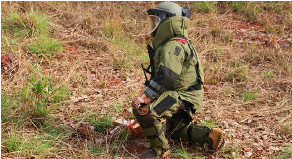
▲ Operation de déminage en cours à Boali

lieux le 18 mars 2022, afin d'évaluer la situation.