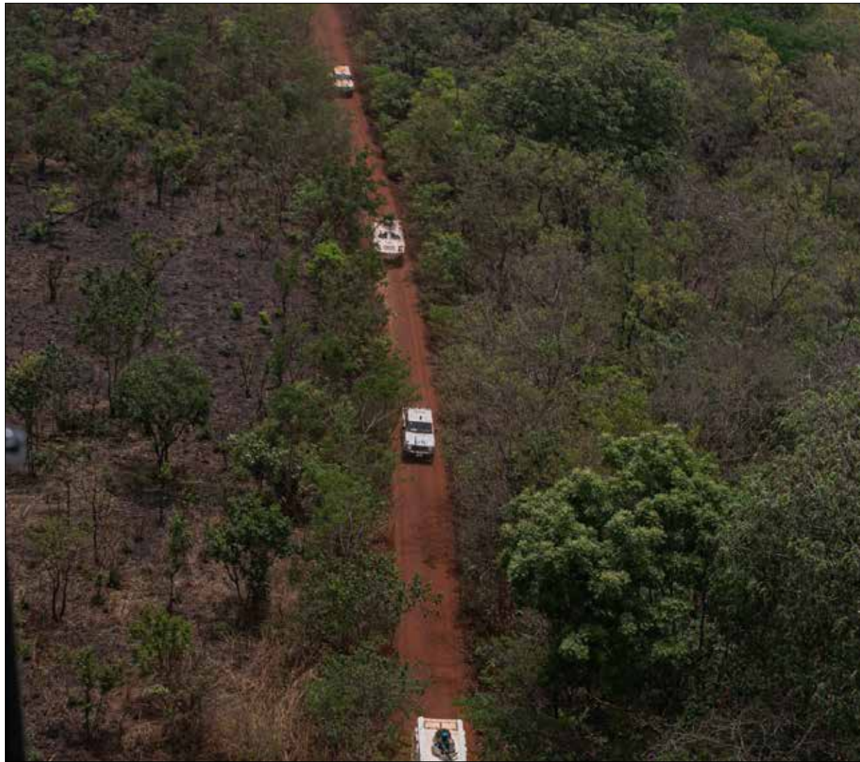
Survol hélicoptère d'un convoi de la MINUSCA sur l'axe Bouca-Batangafo

de Bocaranga, les bataillons tanzaniens et bangladais ont conduit une patrouille conjointe à Tao-Nzoro-Bezere. Les Casques bleus portugais, quant à eux, ont mené une patrouille conjointe avec la Police de la MINUSCA, UNPOL et les Forces de sécurité intérieure dans les alentours de Bocaranga, avant de se rendre avec le bataillon bangladais à Pakale, puis de dominer l'axe Letele-Ndim jusqu'à Ngaoundaye, en passant par Mann», a-t-il déclaré lors de la conférence de presse hebdomadaire de la MINUSCA du 6 avril 2022. « Comme vous pouvez le constater, le nombre d'incidents et d'attaques dans la zone a drastiquement diminué depuis quelques