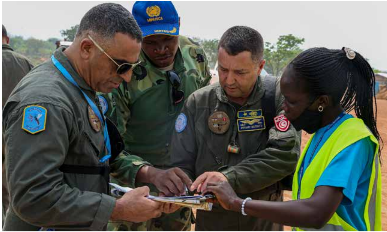
Bossangoa : séance de reconnaissance cartographique des zones de survol par les pilotes de l'Unité des hélicoptères de l'armée tunisienne

des dons de fournitures scolaires et d'équipements sportifs ont été faits par des Unités de la Force.