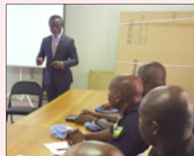
ILLUSTRATION DE FORMATIONS RÉCENTES DONNÉES PAR CDT EN PARTENARIAT AVEC LA COMPOSANTE POLICE DE LA MISSION :

la première journée de cette rencontre pédagogique qui lui a permis de réaffirmer l'importance du rôle des points focaux EAS dans le dispositif mis en place par la mission dans sa lutte acharnée pour prévenir et éradiquer les EAS, qu'il a qualifiés « d'ennemis communs » ■